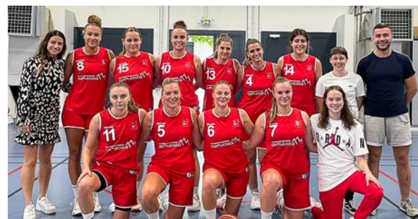
Les seniors 1 de l'ASLV.

Les équipes U11, U13 2 et U15 2 ont bien défendu les couleurs de l'ASLV basket durant cette première phase de championnat. Les équipes U13 1, U15 1 et U18, engagées toutes les trois en phase pré-ligue, n'ont pas réussi à se qualifier pour le championnat régional. Elles évolueront donc en championnat départemental pour la seconde phase.