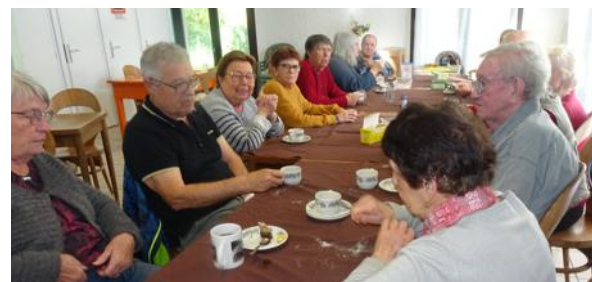
À l'heure du goûter.

La traditionnelle rencontre des amateurs de cartes et de douceurs gustatives s'est tenue dans la salle communale, en début de semaine, alors que tombait la pluie. La douzaine de fidèles du départ a grossi avec l'amélioration du temps et 16 amateurs de jeux de cartes se sont livrés à des parties conviviales. À 16 heures, les joueurs ont profité d'un sympathique goûter. Pour l'heure, la date du prochain repas au restaurant, n'est pas encore fixée, sachant qu'il aura lieu en novembre.