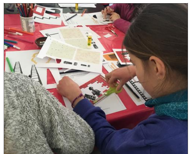
Onze enfants de 8 à 12 ans ont participé à l'atelier de mercredi.

L'exposition "Vivian Maier. Street photographer", gratuite, est à découvrir au musée de l'Ancien Évêché jusqu'au 22 mars.