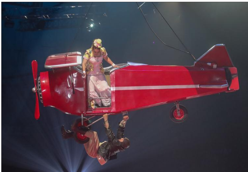
Grâce au retour du festival au Palais des sports de Grenoble, des numéros aériens sont désormais proposés.

Ce sera un anniversaire sans faste, promet Guy Chanal. « L'heure est à la sobriété », assure le directeur du Festival du cirque. Du moins en ce qui concerne l'organisation car pour la scène, ce sera tout le contraire. Avec même un cadeau pour le public à l'occasion de ces vingt ans : une baisse de 8 % du prix des billets (soit entre trois et quatre euros de réduction) et la création d'un tarif enfant. 12 000 places ont été vendues selon l'or-