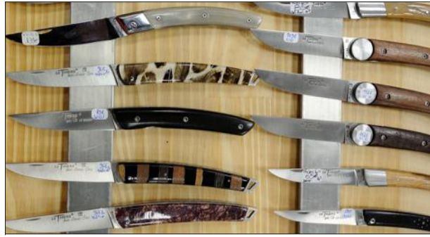
Une soixantaine d'artisans d'art montreront leur savoir-faire à l'espace Jean-Couty.

Le couteau sera élevé au rang d'objet d'art, ce week-end, au cours du Salon du couteau et des arts de la table de Lyon. 60 artisans d'art et couteliers-forgerons présenteront leurs créations et leur savoir-faire au cours des deux jours du salon. Couteaux de chasse, couteaux d'art, couteaux de poche, couteaux tactiques, et coffrets de couteaux de table seront ainsi exposés. Vous