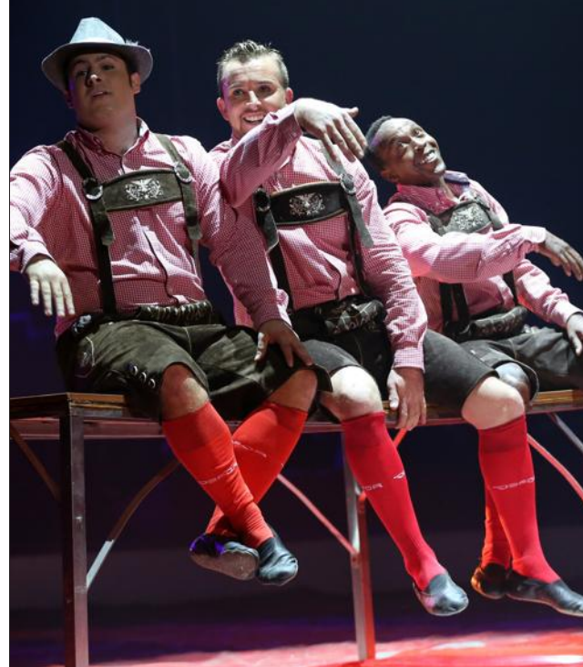
Les Helmut Brothers ont réalisé un numéro d'acrobaties et de clowns.